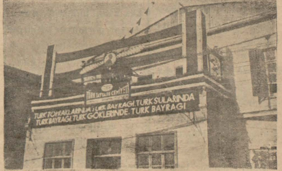
Türk Hava Kurumu Mersin Şubesi yapısı

TOPRAKLARIMIZA ATEŞ VE ZEHİR SAÇACAK UÇAKLARI KISKIVRAK BAĞLIYABİLMEK İÇİN EN AZ 500 UÇAĞIMIZ OLMALIDIR.